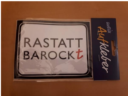
Sticker „Rastatt barockt“