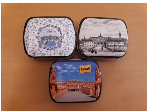
Pfefferminzdose mit verschiedenen Motiven