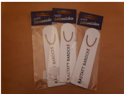
Lesezeichen „Rastatt barockt“